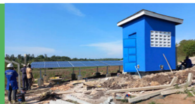
WATER COMPASS UGANDA 2023-25