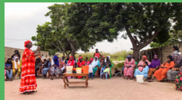
HAMAP-HUMANITAIRE SÉNÉGAL 2024-26

« Nos 4 systèmes d'approvisionnement en eau à énergie solaire bénéficient à 7 234 personnes dans le district de Sembabule. Le soutien de la Fondation SUEZ nous a permis de valider notre modèle durable : libérées de la corvée d'eau, les femmes peuvent désormais se consacrer à des activités économiques. »