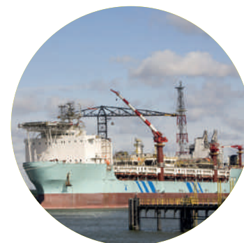
Unité flottante utilisée dans l'industrie pétrolière

Au Brésil , Degrémont poursuit son développement dans le traitement de l'eau pour l' industrie pétrolière , un marché très prometteur. La société a ainsi remporté un contrat d'ingénierie et de fourniture d'unités de traitement d'eau pour une plateforme pétrolière du Groupe Petrobras au large des côtes brésiliennes. Degrémont propose aujourd'hui des solutions particulièrement novatrices pour l'élimination des sulfates, une étape essentielle du traitement de l'eau dans la production pétrolière. Les unités d'élimination des sulfates traiteront l'eau de mer pour la rendre propre à l'injection d'eau. Ce procédé évite d'obstruer la roche poreuse des réservoirs et contribue ainsi à améliorer la récupération du pétrole. D'autre part, les unités d'osmose inverse transformeront l'eau de mer en eau douce, afin d'abaisser le taux de salinité du pétrole brut.