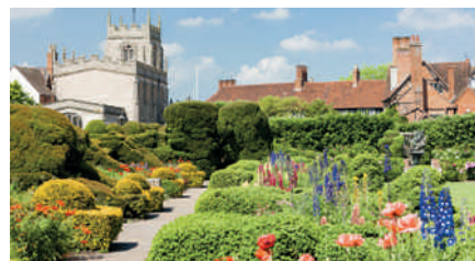
Rugby dans le comté de Northamptonshire

A compter de 2015, les déchets seront valorisés en combustibles alternatifs dans la nouvelle unité de SITA UK située à Rugby ; ce combustible sera ensuite livré à la société cimentière Cemex qui s'en servira pour alimenter les fours de son usine.