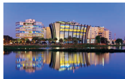
La ville de Bangalore en Inde

SUEZ ENVIRONNEMENT est présent en Inde depuis 30 ans via sa filiale Degrémont qui a construit et exploite plus de 160 usines dans le pays, fournissant chaque jour 5 milliards de litres d'eau à 44 millions d'habitants. Dans le domaine de l'assainissement, ses stations d'épuration traitent l'eau pour 5,5 millions d'habitants.