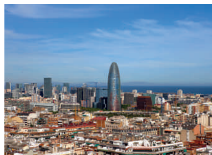
La tour AGBAR à Barcelone

Avec cet accord, l'AMB renforce sa coopération avec Agbar en lui confiant la gestion de l'assainissement, en plus de la distribution d'eau qu'Agbar opérait auparavant. Ainsi, Agbar, le leader du secteur de l'eau en Espagne et acteur majeur du cycle de l'eau en Amérique Latine, mettra au service de la nouvelle société, Aguas de Barcelona, et à ses 940 collaborateurs, ses connaissances et son expérience dans le cycle de