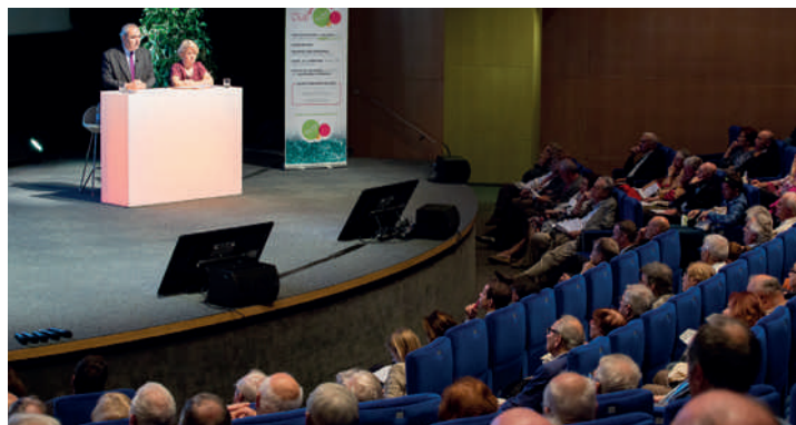
Réunion d'actionnaires à Toulouse