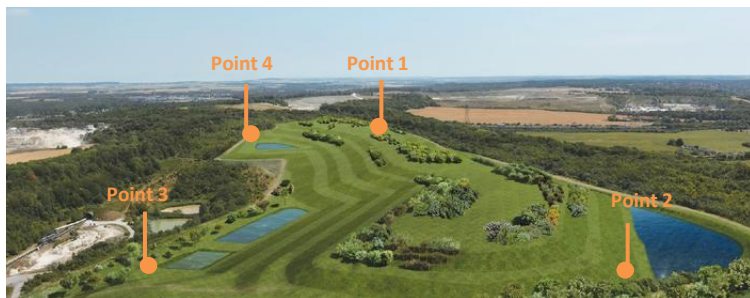
Position des points de mesure sur le site

www.suez.fr/fr-fr/installation-de-stockage-dechets-dangereux-villeparisis