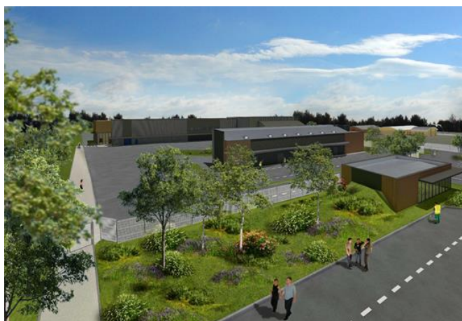
Vue du pôle Environnement de Salvaza